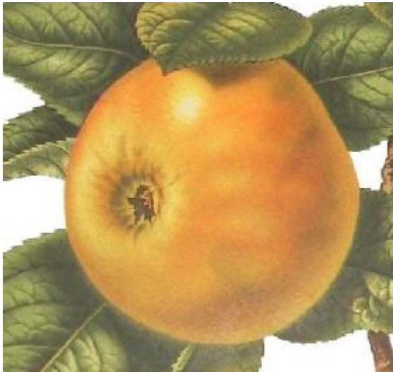
Flora en Pomona, 1875.

MATURITE-CONSOMMATION : Décembre-Février.